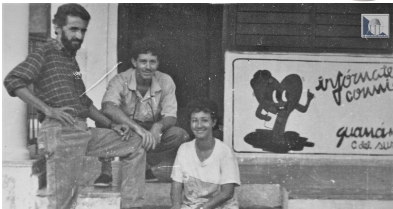
Primer equipo de la corresponsalía de radio