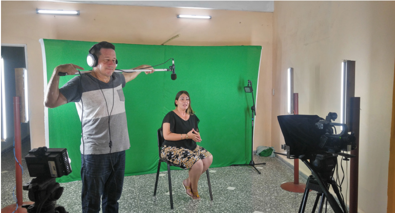
Grabando un programa en la TV municipal