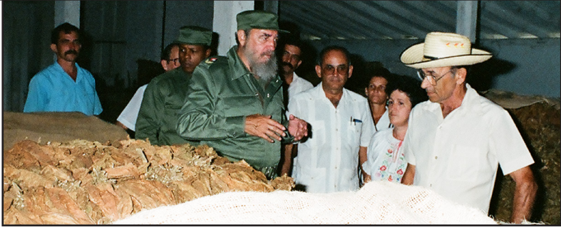
Fidel conversa con campesinos de la CPA Eliseo Caamaño

En el alegato de autodefensa presentado por Fidel Castro en el juicio del Moncada, el joven abogado resume la penosa situación de Cuba y esboza como la Revolución transformaría aquella realidad.