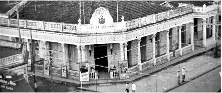
Casino español, esquina de la avenida 51 y calle 62

El entorno inmobiliario que Consolación del Sur heredó de la colonia asumía un carácter marcadamente vernáculo, al que incorporó lo más útil y en ocasiones lo hermoso de cada estilo. Esta tipología constructiva se mantuvo inalterable hasta comienzos del siglo XX, cuando irrumpe la influencia del neoclasicismo, corriente que aspira a restaurar el gusto y las normas del clasicismo grecorromano y renacentista.