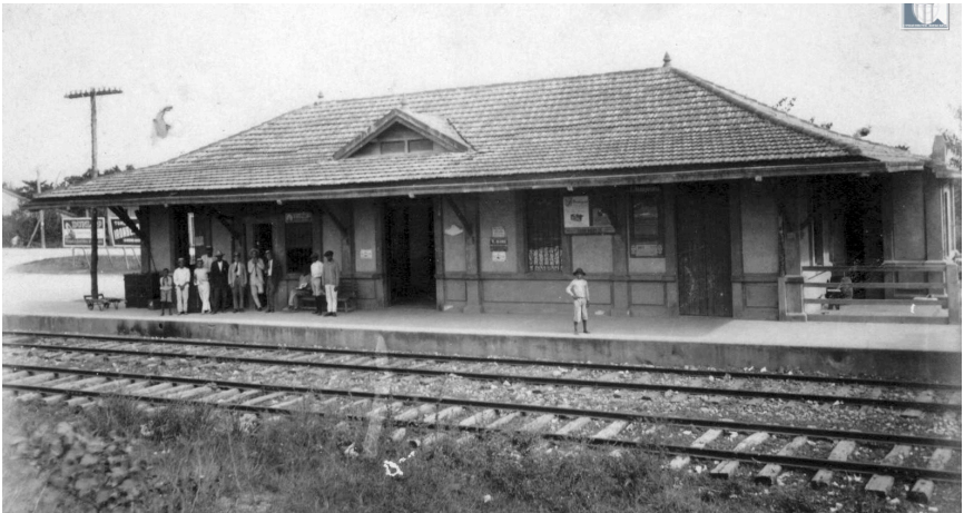
Estación de trenes construida en la Zona Villa de Consolación del Sur

La presencia del ferrocarril en Cuba se remonta al 19 de noviembre de 1837, cuando quedó construido un tramo de 29 kilómetros que unía La Habana con el pueblo de Bejucal. El éxito de aquella empresa estimuló la aplicación de este medio de transporte a otros. En 1857 comienza la construcción del tramo entre la capital y Pinar del Río; pero los estragos económicos de la guerra de 1868 detuvieron la empresa.