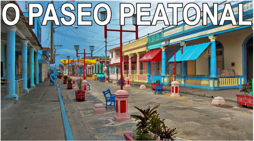
Tramo de la calle 53 convertido en Bulevar

En los últimos años una obra ha desatado la polémica, la modificación realizada al tramo de la calle 53 entre 64 y 66, unos lo llaman bulevar; otros paseo peatonal y no falta el que censura la nueva senda. Pero todos disfrutan la estancia en aquel lugar mientras sentados en uno de sus bancos esperan para adquirir un producto, merendar, resolver un trámite, conversar o sencillamente pasear.