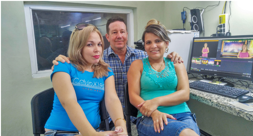
Equipo de trabajo de Consurvisión