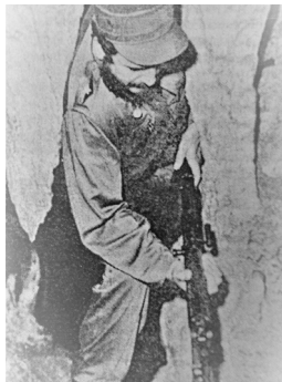
Gran Caverna Santo Tomás

Fidel generalizó aquella experiencia creando la Escuela Nacional de las Milicias Revolucionaria en la Base de San Julián. El 20 de mayo de 1960 el Comandante en Jefe presidió el acto de la primera graduación de aquel centro.