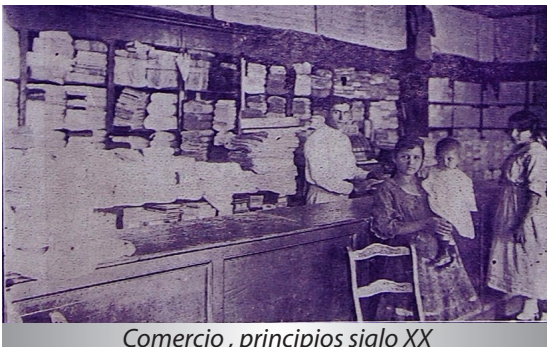
Comercio, principios siglo XX

Los buenos negocios tabacaleros estimularon el resto de la economía local, en lo fundamental el movimiento comercial y financiero. Aumentó el número de escogidas, "chinchales" que torcían puros, tiendas, bodegas, almacenes y otros expendios que mostraban abundantes ofertas. Los ricachones del pueblo y su familia compraban al por mayor; los vegueros cuando mas adquirirían una guayabera