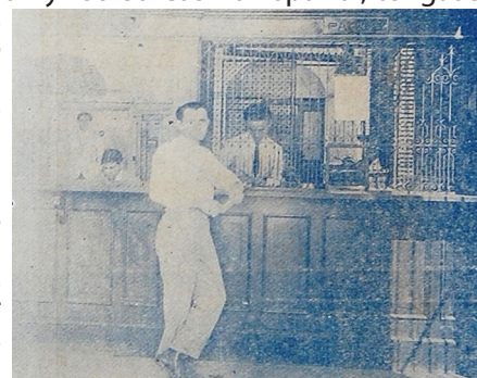
Caja central del BNC, C. del Sur

Años después desaparece aquella Sucursal del Banco Nacional de Cuba en este municipio y algunos de los servicios que prestaba lo asumieron las casas comerciales más poderosas de la localidad.