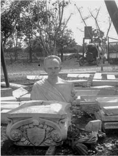
Busto de José Martí, cuando llegó a Consolación del Sur

El 28 de enero de 1853 nace en La Habana José Martí Pérez. Político, maestro, escritor, periodista, pedagogo, apóstol y héroe Nacional de la República de Cuba. A los 17 años fue condenado a presidio y en 1871 desterrado a España donde se gradúa como abogado. Vivió exiliado en México, Guatemala, Venezuela y Nueva York. Fundó en 1892 el Partido Revolucionario Cubano. Unió a los cubanos para reiniciar la lucha por la independencia en 1895. Su obra intelectual y revolucionaria es inmensa, labor que le ha concedido un lugar especial en la memoria de la humanidad.