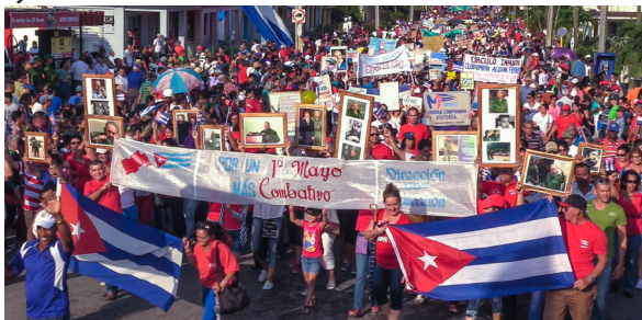
Desfile, 1ro de mayo de 2018

No ha sido fácil el camino a lo largo de 60 años, pero ahí está la incuestionable obra la Revolución en esta localidad, legado que hemos forjado entre todos y del que todos nos beneficiamos.