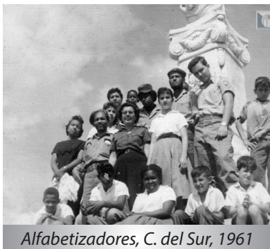
Alfabetizadores, C. del Sur, 1961

Antes de 1959 la educación en Cuba era uno de los sectores más abandonados, situación que se hacía evidente en Consolación del Sur por la carencia de escuelas, los problemas constructivos, en el mobiliario escolar y los materiales para el estudio. Solo existía un aula para la educación preescolar (kindergarten). La educación especial y politécnica se desconocía. La enseñanza media era para la minoría y apenas un reducido grupo pudo alcanzar la educación superior. El índice de analfabetos oscilaba alrededor del 36% y la asistencia escolar nunca superó el 70 %.