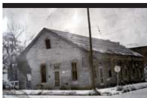
Casa de Paulina Pedroso en Tampa

A su regreso de Mantua, Maceo volvió a Pilotos, permaneciendo en el poblado los días 29 y 30 de enero de 1896. Allí dictó una circular prohibiendo todo tráfico comercial que apuntalara el gobierno colonial, prohibiendo de esta forma el tráfico de tabaco, leche, piña, carbón y cuantos artículos favoreciera al enemigo.