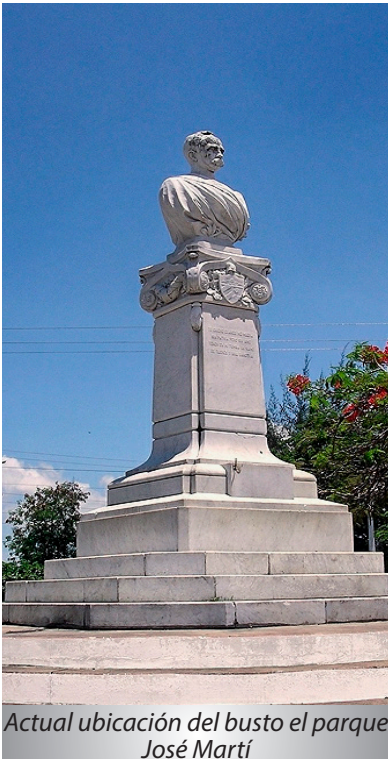
Actual ubicación del busto el parque José Martí

Presumiblemente los que encargaron la obra no ofrecieron al escultor suficientes detalles acerca del prócer, y mientras el artista italiano cincelaba en el duro mármol de las canteras de Carrara la imagen de Martí, pasó por alto que se trataba de un héroe cubano y en lugar de la modesta levita que este usaba regularmente, esculpió -en su torso- una toga romana a usanza de los "Césares".