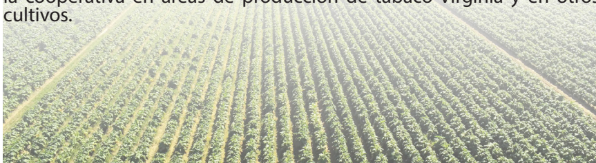
Vista aerea de las plantaciones de tabaco virginia en la UBPC Julian Alemán

En intercambio con trabajadores de las casas de cura se interesó por la eficacia del nuevo sistema y la eficiencia en el uso combustibles alternativos como madera y sub productos agrícolas que se utilizan para la cura de las hojas. Las cámaras instaladas tienen capacidad para beneficiar 1 tonelada por ciclo con significativa reducción del consumo. Al concluir la visita a las áreas productivas de la UBPC Julián Alemán instó a directivos de la agricultura a generalizar las experiencias de la cooperativa en áreas de producción de tabaco Virginia y en otros cultivos.