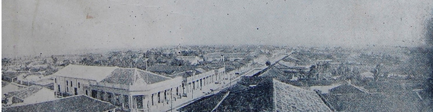
Vista aerea de Consolación del Sur a principios del siglo XX

Entre 1914 y 1918 ocurre la Primera Guerra Mundial, el conflicto involucró a las grandes potencias de aquel momento, trayendo la ruina a la economía europea y la de otros países implicados. Como era de esperar creció la demanda de muchos productos, sobre todo en las regiones en conflicto. Entre las mercancías de gran demanda estaba el tabaco; circunstancia aprovechada por los productores consolareños, fundamentalmente en Puerta de Golpe, para crecer en la producción de la hoja.